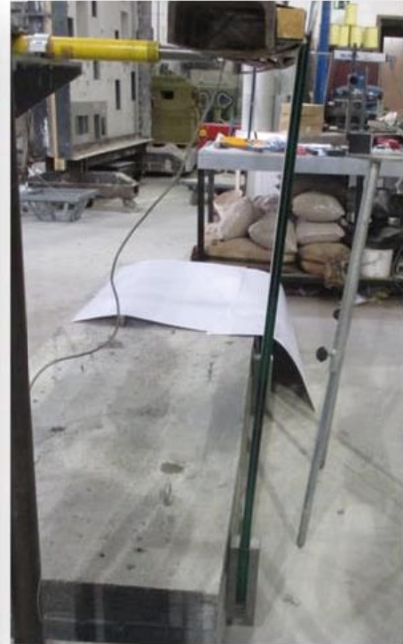
Aspecto tras el empuje horizontal hacia el exterior