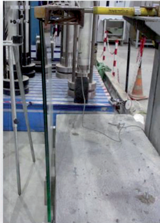
Aspecto tras el empuje horizontal hacia el exterior